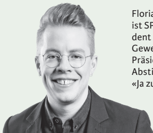
Florian Vock von Baden ist SP-Grossrat, Präsident des Aargauischen Gewerkschaftsbunds und Präsident des nationalen Abstimmungskomitees «Ja zum Schutz vor Hass».

Die bestehenden Gesetze schützen Lesben, Schwule und Bisexuelle nicht vor Hass und Diskriminierung. Das zeigen aktuelle Fälle. Um dagegen vorgehen zu können, braucht es die Erweiterung der Anti-Rassismus-Strafnorm.