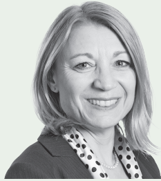
Yvonne Feri von Wettingen ist SP-Nationalrätin.

DIE MIETEN IN DER SCHWEIZ SIND SEIT DEM JAHR 2000 UM 27 PROZENT ANGESTIEGEN, HEUTE GIBT ES VIEL ZU WENIG GÜNSTIGEN WOHNRAUM. DIE ENTWICKLUNGEN AUF DEM WOHNUNGSMARKT HABEN VIELE NEGATIVE AUSWIRKUNGEN, DENEN DIE INITIATIVE «MEHR BEZAHLBARE WOHNUNGEN» MIT KONKRETEN MASSNAHMEN BEGEGNEN WILL.